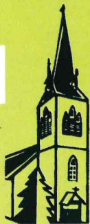
Ev. Kirche Braunlage